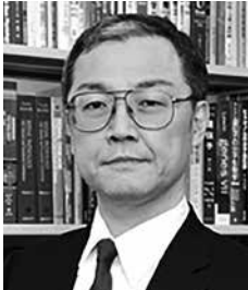
埼玉透析医学会 会長