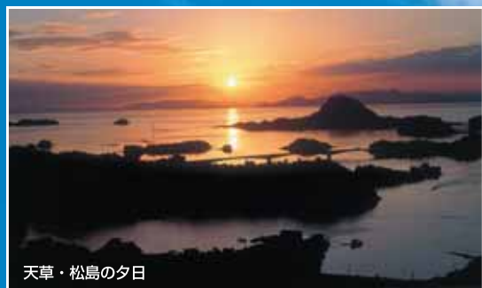
天草・松島の夕日